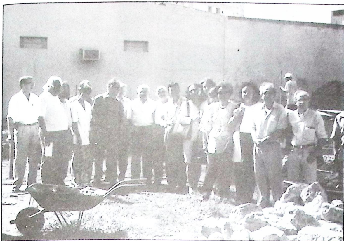
Associados em visita ao canteiro de obras da futura sede do IHGG